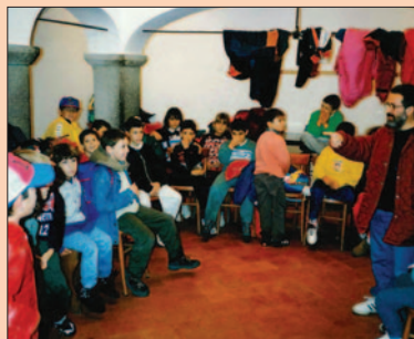
Elementari e Medie