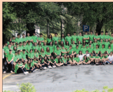
Liceo Scientifico Sportivo